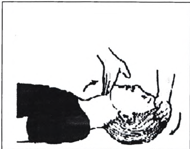
Рис. 2. Маневр открытия верхних дыхательных путей путем запрокидывания головы.

Контролируйте эффективность вдоха по экскурсии грудной клетки. Для детей старше 1 года при отсутствии мешка Амбу используйте методику дыхания рот в рот (зажимая ноздри).